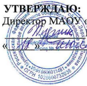
ГРАФИК движения школьного автобуса по маршруту № 3 на 2023 – 2024 учебный год